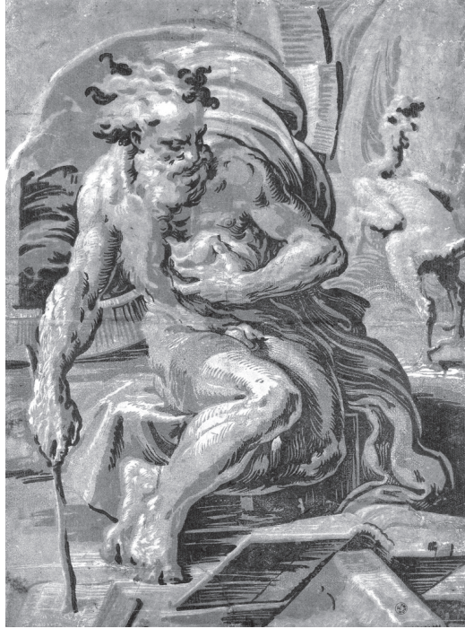
Abb. 1: Diogenes mit Platons Mensch. Ugo da Carpi, Diogenes, Homo Platonicus. Holzschnitt (1526)

einer bis heute nicht abgerissenen Kette unschmeichelhafter Kommentare. Im 16. Jahrhundert rechnete Montaigne Platons Definition unter die «Eselstreiche, welche die menschliche Vernunft begeht». Unser Wissen, so meint Montaigne in seiner Schutzschrift für Raimond von Sebonde, gleicht jenen bewohnten Ländern, die von Sümpfen, Wäldern und Wüsten umgeben sind; es bildet nur kleine Inseln in einem Meer der Unwissenheit. «Dieses ist die Ursache, warum diejenigen, welche die erhabensten Sachen abhandeln, und am weitesten darinnen gehen, in die größten und kindischsten Fehler verfallen, und sich in ihrer Neugierde und Einbildung vertiefen. Das Ende und der Anfang der Wissenschaft laufen auf gleiche Dummheit hinaus. Man betrachte einmal den Plato, wenn er sich in seinen poetischen Wolken in die Höhe schwingt. Man betrachte einmal bey ihm das kauderwälsche Geplauder der Götter. Allein, wo dachte er dann hin, da er den Menschen als ein zweyfüßiges Thier ohne Federn beschrieb? Er gab hiedurch denenjenigen, die ihn zu verspotten geneigt waren, eine schöne Gelegenheit: denn, sie rupften einen Kapaun leben-