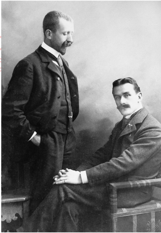
Thomas und Heinrich Mann in München, um 1900

Freilich rechnete man auch hier zu den «Gebildeten» nicht nur die Inhaber von sogenannten «Bildungspatenten», also die Inhaber von akademischen Abschlußzertifikaten, wie Max Weber das spöttisch nannte. 7 Thomas Mann beispielsweise wurde selbstverständlich unter die «Gebildeten» gezählt, obwohl er nie ein reguläres Studium absolviert hatte, und das galt für viele andere. Entscheidend war das Maß an «allgemeiner Bildung», über das sie verfügten, wobei «Bildung» mehr besagte als bloßes Wissen, und sei es auch noch so ausgedehnt, mehr auch als reines Berufs- und Leistungswissen. Es meinte zugleich eine bestimmte Geisteshaltung, einen bestimmten Lebensstil und eine bestimmte Lebensform, die Hinwendung zu und das Verwurzelte sein in den Sphären von Kultur, Geisteswelt und Kunst, aber auch allgemeine Formen des Umgangs, der sprachlichen Artikulationsfähigkeit – kurz, all das, was man chiffernmäßig mit dem Begriff des «gebildeten Menschen» bezeichnete, ein Status, zu dem prinzipiell jeder gelangen konnte, auch wenn die Wortführer